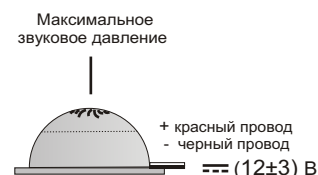
Диаграмма направленности в свободном пространстве